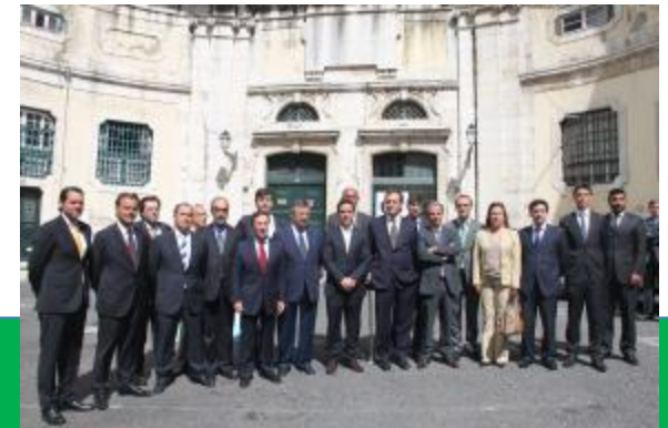
Cerimónia de assinatura do Protocolo - 7 de maio de 2014