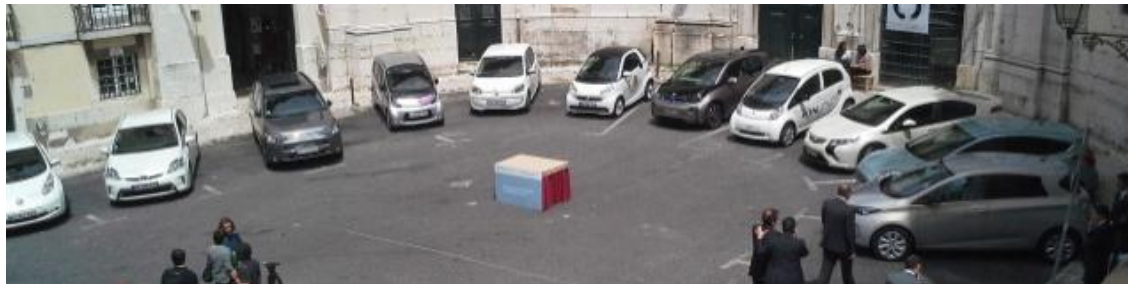
Cerimónia de assinatura do Protocolo - 7 de maio de 2014